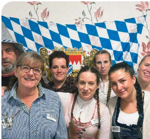
(Team Tagespflege) Das Team unserer DIAKONIA Tagespflege beim Oktoberfest. Eine Veranstaltung nur für unsere Gäste der Tagespflege.

seniorengerechten, aber dennoch selbstverantwortlichen Wohnens und Lebens. Aus Nachbarschaften sind echte Freundschaften geworden und der Gemeinschaftsraum ist mehr denn je ein beliebter Treffpunkt der Mieterschaft.