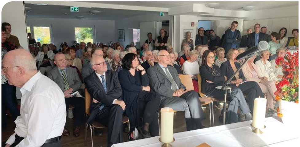
(Blick ins Publikum) Feierliche Eröffnung der beiden neuen Geschäftsbereiche DIAKONIA Tagespflege und Betreutes Wohnen im „Belgischen Viertel“ im Gemeinschaftsraum des BeWos.